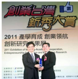
宗權處長（左）手中接下獎座】