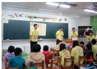
【上圖：杏青康輔醫療服務隊於社區進行義診（左）及帶領小朋友進行團康遊戲（右）】