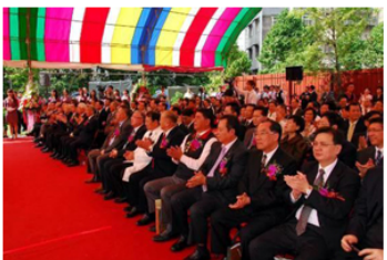
【圖：各界貴賓（下右）幾乎全程參與簡單隆重的動土典禮，由祥獅獻瑞開始（上左）、開工祝禱祭拜（上右）、動土儀式（下左）】