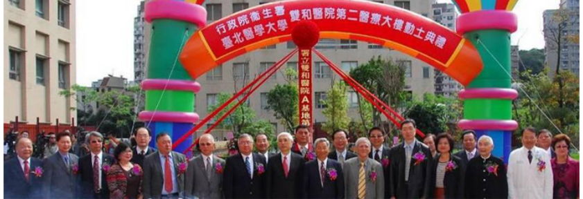
【圖：雙和醫院第二醫療大樓預計2014年完工啓用】

爲因應新北市長期照護需求日增，雙和醫院在建構完整的急重症醫療體系後，積極籌建第二醫療大樓，爲地下5層、地上17層樓的建築，2012年3月6日舉行動工儀式，預計於2014年啓用，屆時全院總床數達1千5百多床，將成爲新北市規模最大的醫療院所。