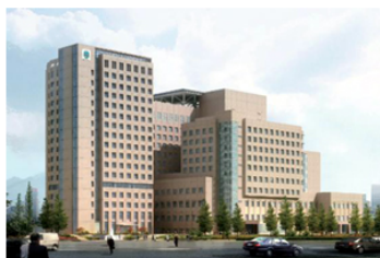
【圖：左為雙和醫院第二醫療大樓動土典禮，右為完工示意圖（左邊直立式建築）】

2011年閻雲回國任職起，即為北醫大未來50年之發展集思廣益，在董事會及全校師生的全力支持下，率先推動「校園總體規劃」，以每個學院及其相關系所在同一大樓，並預留未來發展空間，各學院並規劃產學育成空間、跨領域研究中心及院級共儀中心，並設置30至50人的中小型教室等為目標，整體考量校園配置、建築間之連結性、開放空間之留設，並以綠建築指標來形塑北醫獨特校園建築外觀。第一階段先改建形體學大樓，將聘請國際建築師進行「醫學院及醫學院大樓興建規劃案」。