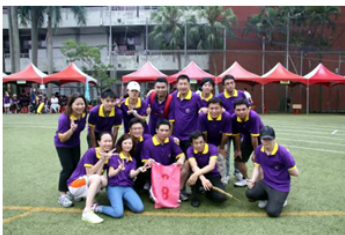
【上圖：左為校友總會代表參加拔河比賽之賣力神情，右為北醫附醫拿下諸項大獎】