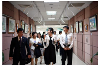
【圖：昆明醫科大學參訪校史館（左上）、圖書館（右上）、雙和醫院臨床技能測驗及訓練中心（左下），及萬芳醫院座談交流（右下）】