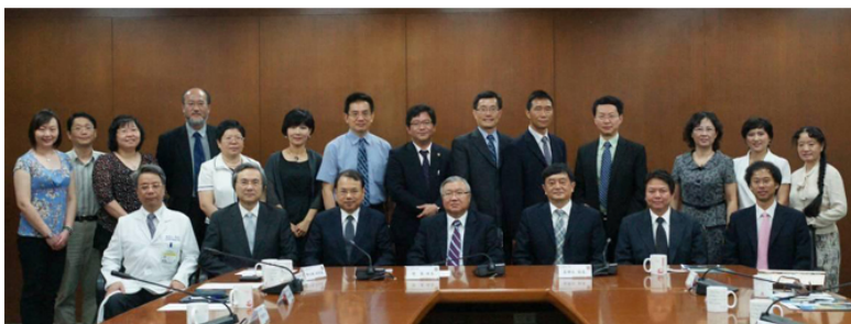
【臺北醫學大學與昆明醫科大學締結姊妹校儀式合影留念】

昆明醫科大學建校近80年，前身是創建於1933年的東陸大學醫學專修科，1956年獨立建院，並於今年（2012年）經教育部批准由昆明醫學院更名為「昆明醫科大學」，網大2011中國大學排行榜醫藥類院校排名第30名。現校園佔地1,631畝，聘有專任教師1,000人，學生16,538人，共有22個本科專業，涵蓋醫學、理學、管理學和社會學科4個學科門類；擁有4所直屬附屬醫院、7所非直屬附屬醫院、10所教學醫院及39所實習醫院，其中第一、第二附屬醫院是衛生部首批評定的「三級甲等」醫院，被衛生部指定為國際緊急救援中心網絡醫院，第三附屬醫院和附屬口腔醫院是雲南省腫瘤和口腔疾病防治中心。