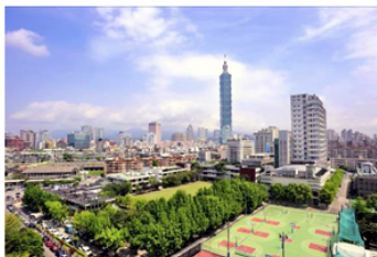
【圖：北醫的蛻變有目共睹】

北醫大在李祖德董事長、前校長邱文達教授（現任衛生署長）及校長閻雲教授的帶領下，於近幾年致力於提升學術研究及國際化，並藉由與著名國際大學及研究機構結盟合作以及增聘國際知名教師等多方面著手，提升北醫大國際知名度及研究動能。在全體師生及同仁的努力下，北醫大於今年在醫學領域與國立台灣大學一同榮登世界前百大（台灣之大學僅北醫大與台大兩所大學名列醫學領域前百大），這是全體師生及同仁的成就與驕傲。