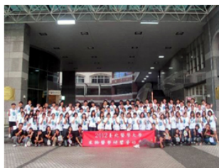
【圖：左為破冰活動，右為第二梯次同學大合照】

本研習營共有全台86校、264位同學參加甄選，爭取160位全額贊助活動費用名額。此次高中生物醫學研習營共計5天4夜，分兩梯次進行，第一梯次為7月25日～29日，其課程結合分子生物學、基因體學、蛋白質體學、結構生物學等領域；第二梯次為8月17日～21日，課程重點在醫學影像與癌症，並配合實驗活動觀察心臟與肺功能的運作。更分別邀請到中央研究院張文昌院士及彭江嘉康院士授課指導，期許培養學生生物醫學的實驗能力及體會研究態度與精神，透過各領域專業師資與完整的實驗教學和操作，帶領同學進一步認識生物醫學的奧秘。