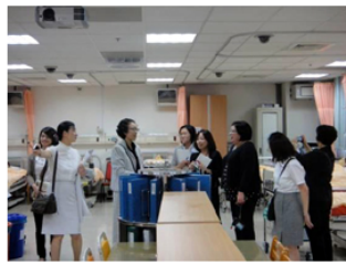
【上圖：左為兩校成員彼此互相介紹，右為參訪護理學院示範病房】【下圖：帝京大學貴賓參訪附設醫院之安寧病房及中醫門診】