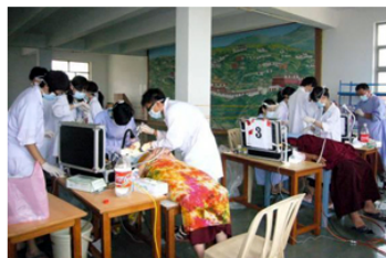
【左圖：2010年馬英九總統（右5）出訪馬紹爾，與該國總統查凱爾（右4）肯定正在該國義診之萬芳醫院眼科團隊】【右圖：北醫大海外醫療服務南印度團在當地義診情形】