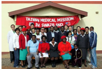
【圖：左為聖國醫療團醫師義診情形，右為史國醫療團與當地協助義診護士合影】

北醫大之附屬醫院更早在2006年起便在國合會的安排下，已籌組超過上百人次之行動醫療，前往巴拿馬、瓜地馬拉、宏都拉斯、馬紹爾、帛琉及海地共和國等地展開醫療服務，並多次參與路竹會之國際義診活動，派遣醫療人員前往斯里蘭卡、寮國、越南等地。而由學生自組的14個服務性社團，也利用每年寒暑假深入全臺各地偏遠地區外，更遠赴澎湖及南印度等地進行醫療服務，參與同學每年超過上千人次，並多次獲得「特優獎」之肯定。當然，北醫校友及師長們更不遑多讓，有多達19人（含兩團體）獲得國內醫療服務最高榮譽之一的「醫療奉獻獎」。