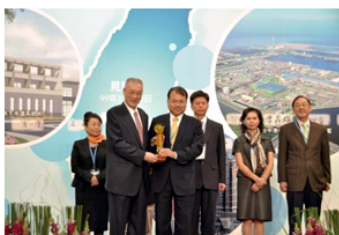
【圖：左為萬芳醫院獲得第20屆中華民國企業環保獎，右為雙和醫院獲得第8屆民間參與公共建設金擘獎】