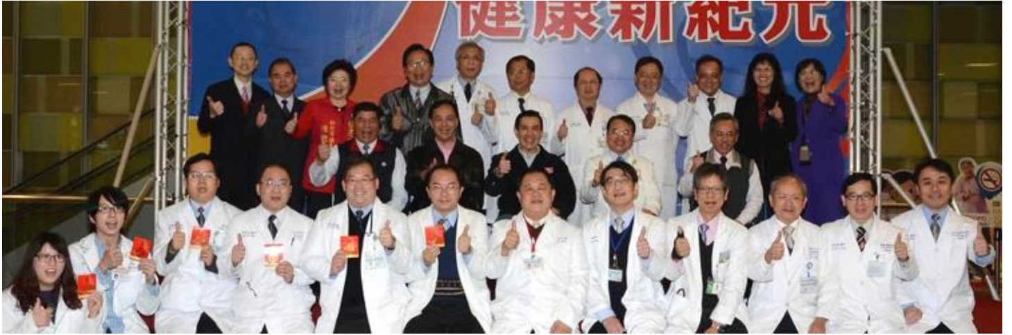
【圖：馬總統（第2排中）與雙和醫院除夕的值班醫療團隊合影】