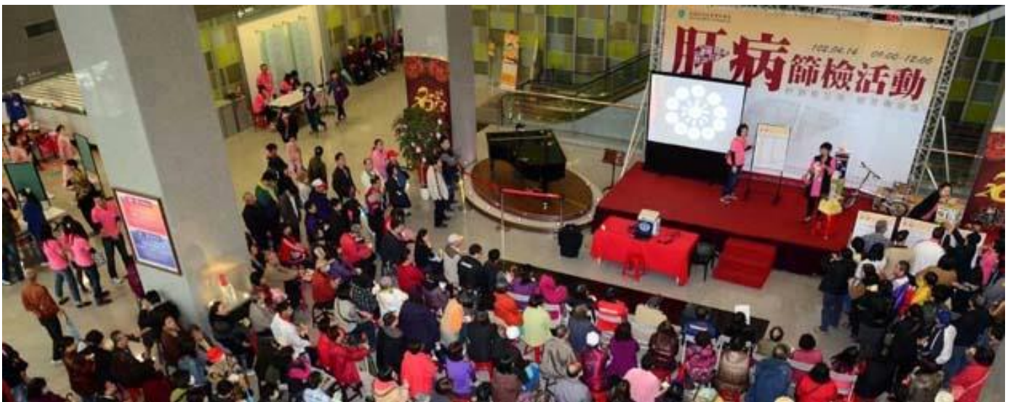
【圖：雙和醫院利用肝病篩檢活動，同時宣導要把握早期治療肝病的先機】

超音波掃描因受限於時間，篩檢當天開放的名額有限，但若民眾收到驗血報告，顯示有 B、C 肝病毒感染，或是肝功能異常的警訊，則可回診，由醫師安排進一步的檢查。肝癌的存活率隨著腫瘤期別的增加而下降，依雙和醫院癌症中心的統計資料顯示，第四期的存活率約 6 個月，但第一期的兩年存活率高達 90% 以上，由此可見早期發現、早期治療的重要性。（文/雙和醫院）【圖：本校韓柏樑教授以自身的抗癌經驗與民眾分享】