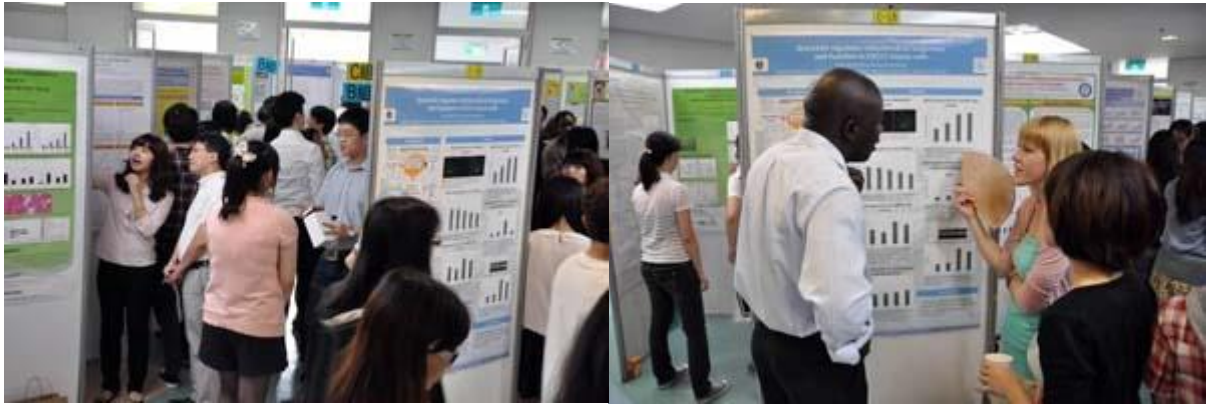
【圖：人山人海的壁報審查現場（左圖），許多外籍學生亦參加評選（右圖）】