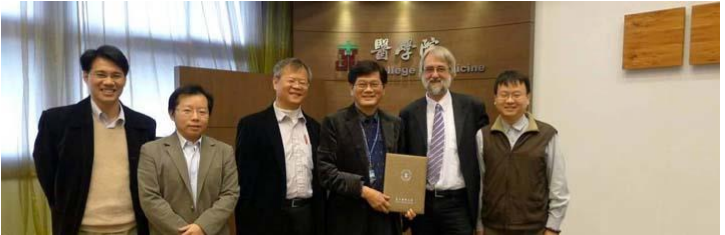
主任（左3）及學術團隊合影】