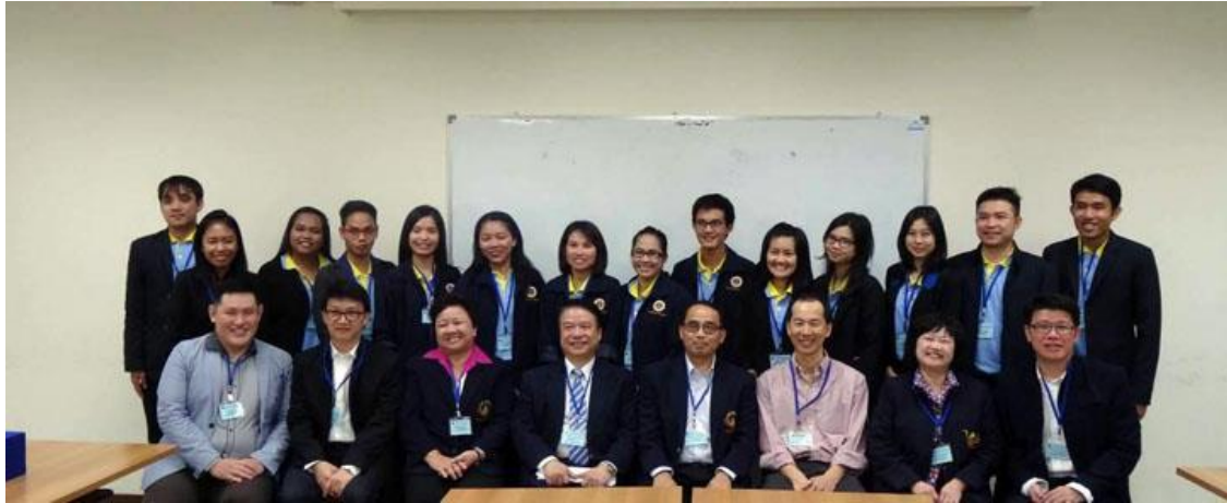
(文/公共衛生暨營養學院公共衛生學系)