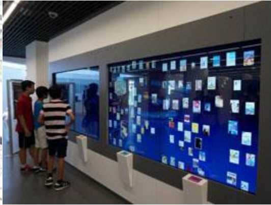
【圖：新北市立圖書館新總館陽光峇里島度假風格的悅讀角（右圖）及數位書牆（左圖）】