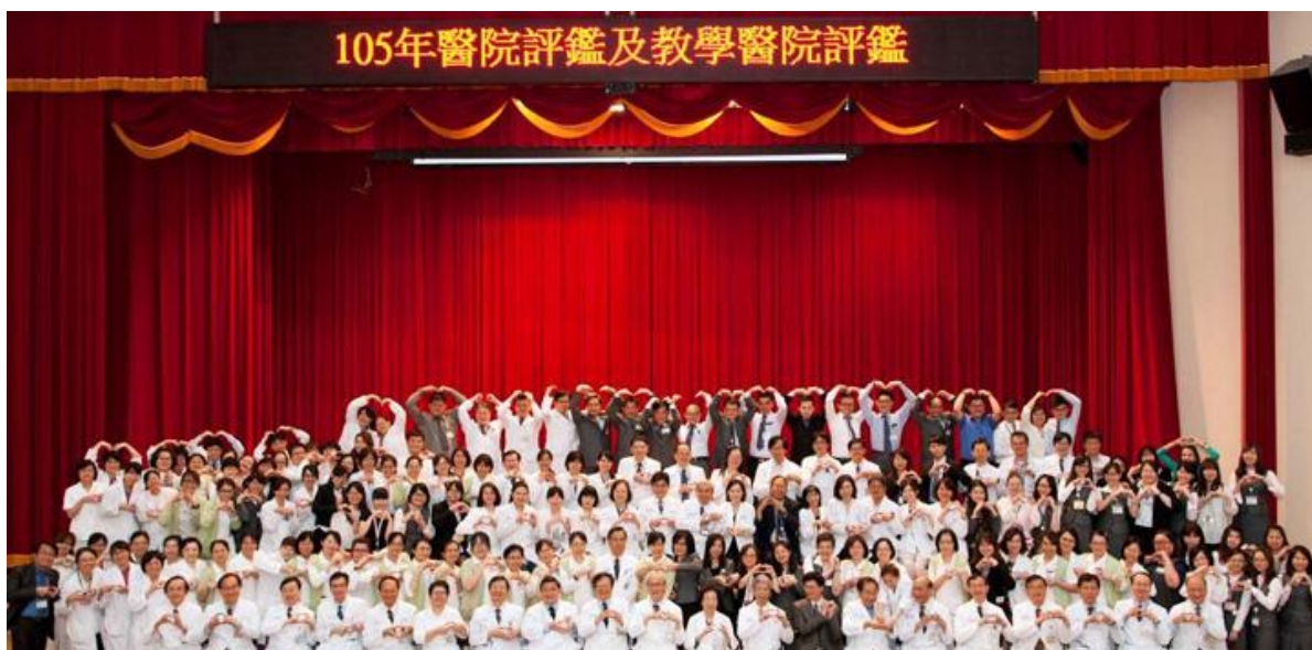
(文/萬芳醫院·雙和醫院·秘書處)

雙和醫院這次挑戰競爭激烈的醫學中心評鑑，表現相當優異，因名額限制而獲得「準醫學中心」，擁有等同醫學中心的榮耀，但健保給付，仍依照區域醫院層級標準。衛福部醫事司長石崇良表示，「準醫學中心」雖給付未調整，但比起區域醫院，仍可能提高民眾就醫意願，也肯定用心追求卓越的醫院。雙和醫院於自 2008 年開院以來持續深耕社區，提供民眾優質的急重症醫療，並引進尖端的儀器設備，致力於以病人為中心的全方位服務，無論在醫療照護或經營管理等各方面的確都深獲肯定。【左圖：雙和醫院醫療品質達醫學中心評鑑優等，為「準醫學中心」】【下圖：萬芳醫院完成醫學中心評鑑後，所有協助同仁合影】