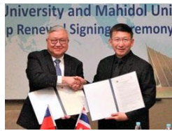
University and Mahidol Uni p Renewal Signing Ceremony

本校致力於推廣國際學術交流，積極爭取與海外大學合作機會，落實本校國際化發展政策，提升國際能見度。泰國馬希寶大學及日本昭和大學於 2017 年 3 月 16 日及 29 日分別蒞校與我簽訂校級及院級備忘錄。