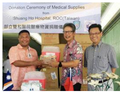
雙和醫院捐贈醫療物資。

雙和醫院繼滾動醫療團深獲馬紹爾人民的肯定後，於 2018 年 6 月再度協助馬紹爾共和國進行結核病及麻瘋病篩檢活動。由於馬國當地除糖尿病、高血壓、寄生蟲感染問題嚴重外，結核病感染問題亦趨嚴重。