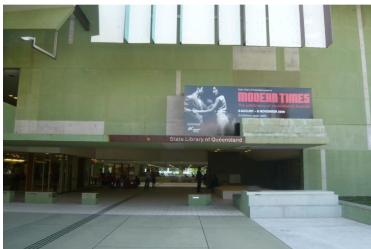
圖 4 昆士蘭州立圖書館外觀

靠河的那側全以落地玻璃來建設，因此視野與採光非常好；館內的傢俱亦經過特別設計，有個人區與團體區，十分舒適且功能性佳；此外，兒童區的規劃也相當貼心。比較特別的是，該館有一個特藏區，蒐集了很多讓民眾尋求家庭歷史與族譜的資料，並整理了一系列三十多份的單張資料，說明相關資源的功用與使用方式。