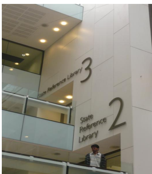
圖 5 昆士蘭州立圖書館各樓層入口