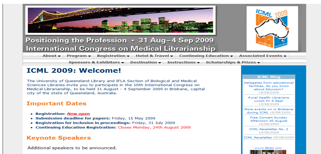
圖 1 ICML 2009 首頁 ( http://www.icml2009.com/ )