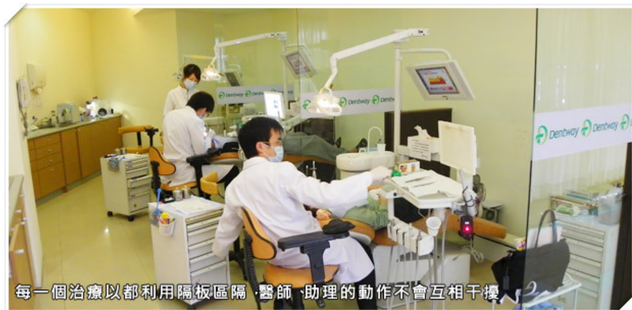
每一個治療以都利用隔板區隔，醫師、助理的動作不會互相干擾

因應時代進步，且隨著規模逐漸擴大，景美德威也不斷引進更好的管理方式，打造理想的醫療環境。為了提昇並維持高水平服務，德威採用國內首見的完整牙科醫療標準作流程 ISO900 認證；不論各項器材、設備的擺置、消毒、感染控制流程、掛號流程等，患者進到診所，就是一系列以客為尊的一致化作業。由於從櫃台作業到醫療流程皆經過 ISO9001 認證，所以診所能將所有人力資源作最有效的規劃，進一步提升醫療及服務的品質來回饋求診患者。