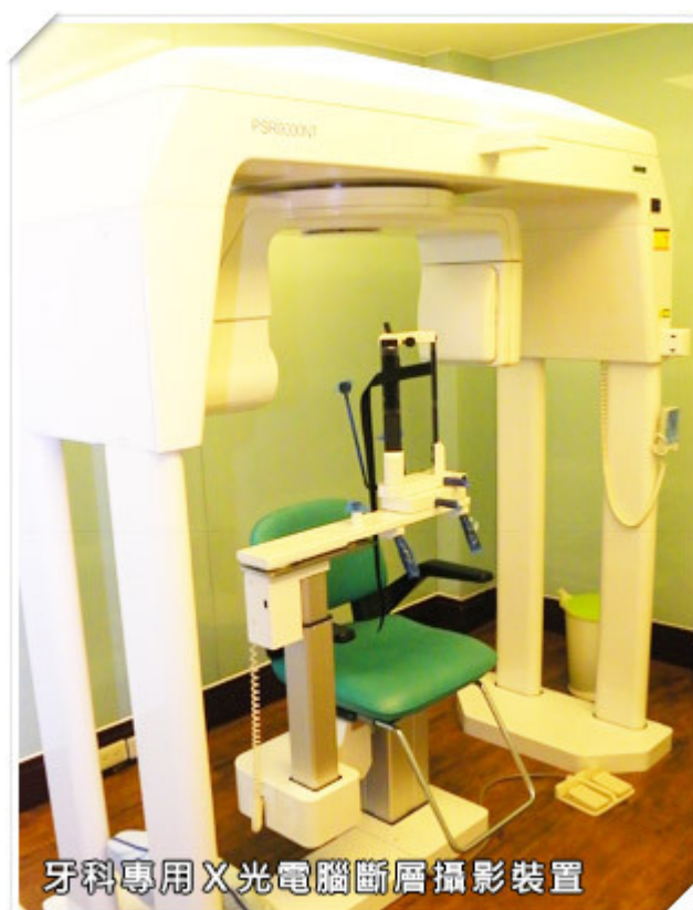
牙科專用X光電腦斷層攝影裝置

努力打造優質醫療環境，是德威的目標；因此除了設備提升、醫療流程的一致化外，德威也相當注重醫師、助理的教育訓練。德威牙醫在招考與聘僱契約上都有明文要求院內的醫師、助理必須按時上課進修；在景美德威的二樓空間還設立專屬教育中心，與全球一流大學合作，引進美國哈佛大學的教育體系，每年提供學員赴美進修學習最新的醫療資訊及管理服務流程。