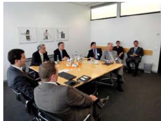
【圖：德國西門子醫療部門廠區同仁為北醫代表進行簡報與討論】