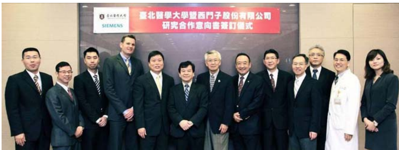
【圖：西門子股份有限公司與本校影像醫學研究團隊合影留念】

為促進醫學影像技術之進步與發展，北醫大於4月12日與西門子股份有限公司簽定研究合作意向書，研究重點著重於電腦斷層掃描（CT Scan）、核磁共振造影（MRI）與核子醫學（Nuclear Medicine）等相關領域，研究宗旨在於以全人之照護為出發點，研發更有效之病症診斷技術，提高診斷正確性、縮短診斷時間，與降低影像檢查之輻射劑量，研究成果將實際應用於臨床之上。合作期間，不僅本校與附屬醫院團隊將積極投入，也將與國內外知名研究機構及學者合作，並舉辦國內外學術交流研討會。