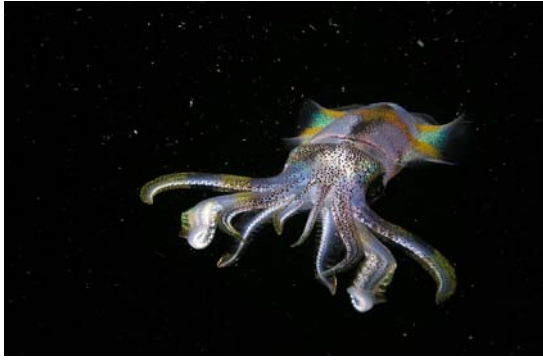
閃閃發亮的鎖管，像不像來自外太空的大怪獸