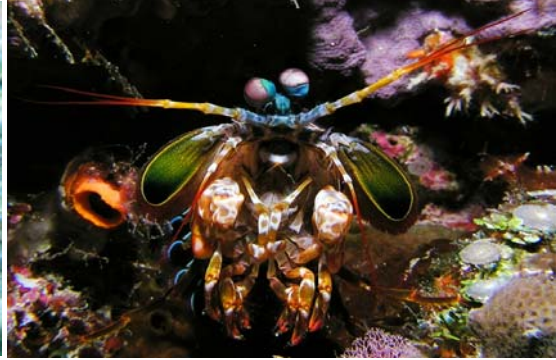
擁有一對「大鉗子」的螳螂蝦，色彩非常艷麗