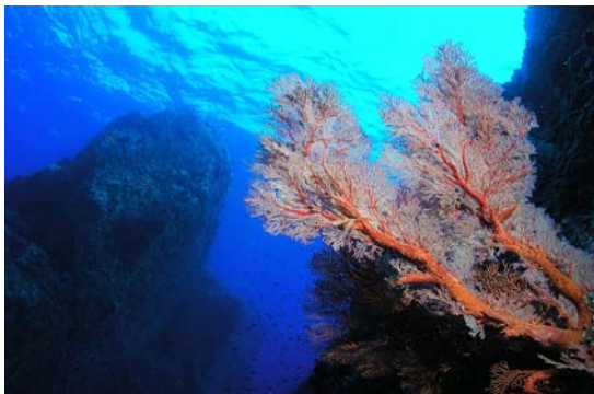
美麗的海扇，攝於綠島海域