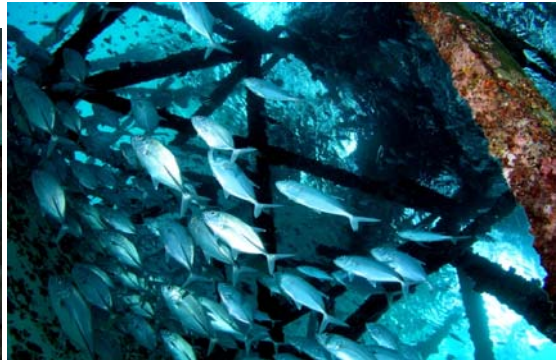
海底攝影題材俯拾皆是，本圖攝於海港旁