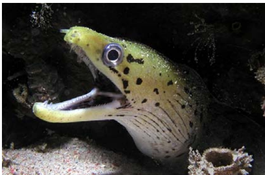
呲牙裂嘴、準備採取攻擊的海鰻