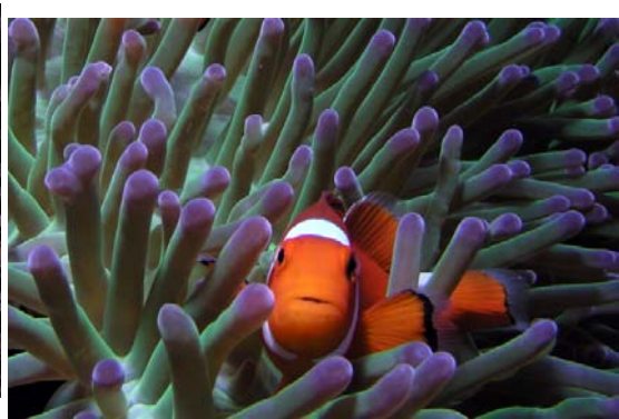
海底嬌客小丑魚，表情生動，像不像動畫明星尼莫呢？