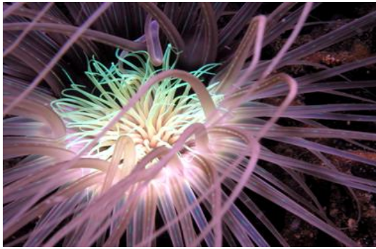
斑斕燦爛的千手海葵，攝於印尼藍碧