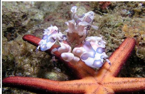
正在享用海星沙西米的油彩臘膜蝦