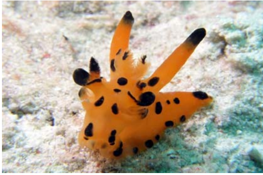
皮卡丘現身？只是長相類似的海蛞蝓啦！