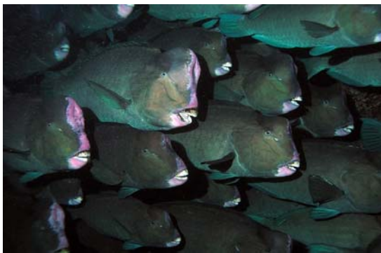
專吃硬珊瑚的隆頭鸚哥魚群，每隻體積可有成人那麼大喔