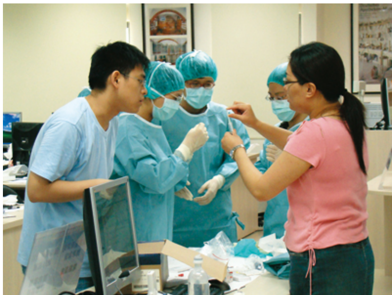
藥學院學生臨床實驗課