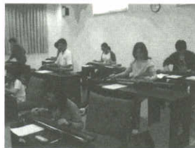
▲北醫同學練習古琴