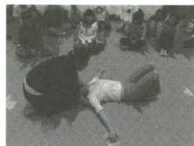
▲古琴課教授末稍用力的方法