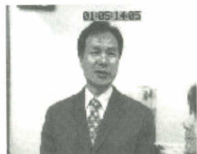
▲衛生局長劉增應醫師接受採訪