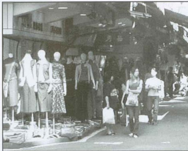
▲五分埔的成衣廠物美價廉

在這做螢火蟲復育的工作，在虎山溪裡你會發現有許多螺，牠們都是螢火蟲幼蟲的食物。初夏之時，同學們可相約至此，很有機會巧遇綻放光彩而翩翩飛舞的美麗螢火蟲，將整個夏夜點綴得浪漫溫馨又難忘。