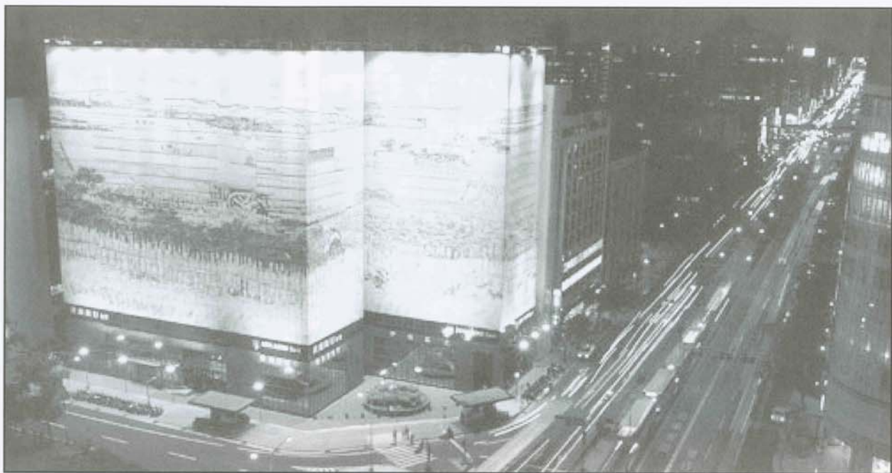
▲浪漫又令人充滿遐思的台北街景