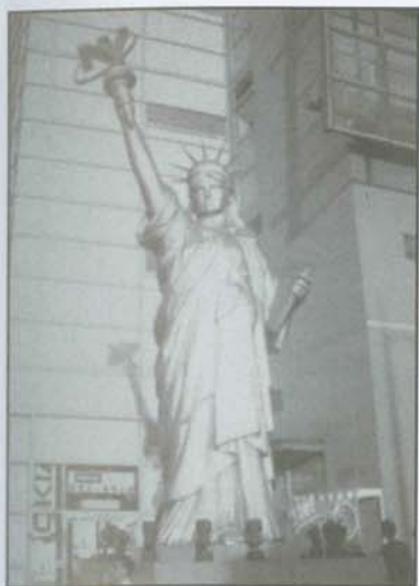
▲來到紐約紐約宛如置身異國街頭