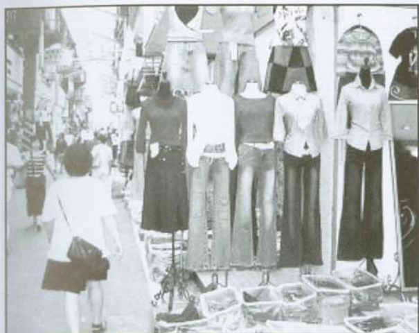
▲五分埔絡繹不絕的人潮