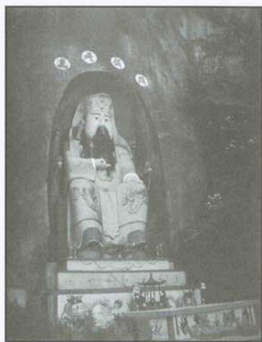
▲座落於獅山腳下的原始天尊像