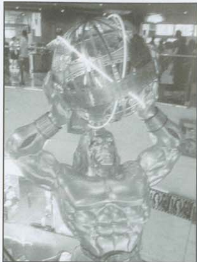
▲華納威秀內部的華麗景象