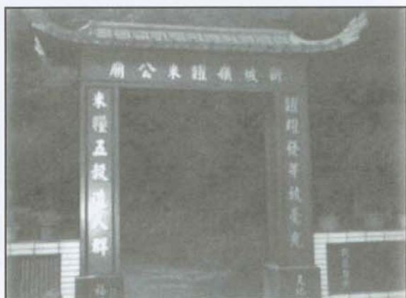
▲樸素精簡糶米古廟大門，百年來見證了多少挑夫尙儂的身影