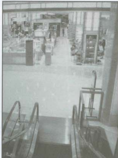
▲新光三越信義新天地