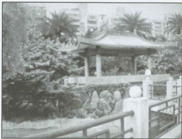
▲國父紀念館內景色宜人