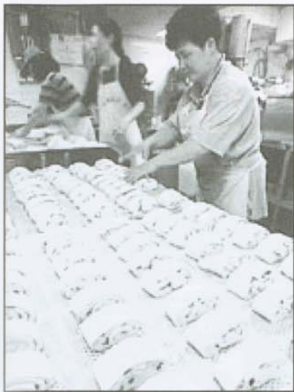
▲六張犁饅頭店，香噴噴的饅頭