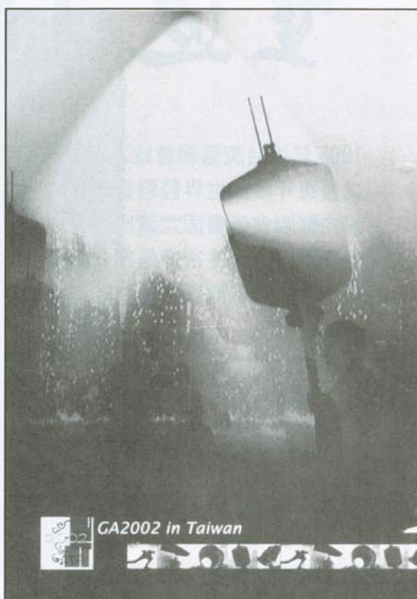
▲ Survival Guide 台灣一書之封底

有主辦國精心規劃的 Social Program，去年 A M 的 Social Program 是由 OC 活動部所負責，第一天的晚會是 Welcome Party，這天晚會的 program 有 Black Light Troupe、DJ and Dancing Time、而最特別的就是學生社團——北醫魔術社所表演的 Magic show。第二天的 Social Program 是 Lion's Out，也就是中國傳統的舞獅表演，接著就是 Outdoor Party。第三天的 Social Program 為 Higt in Height，是一場在台北的京華城所舉辦的 party。會期第四天的下午是 Day tour in Taipei，可以有三種選擇：故宮、陽明山國家公園或者九份，到了傍晚選擇三條不同路線的醫學生，會在福華渡假飯店的太平洋翡翠灣集合，夜色來臨時，在無垠的沙灘上放天燈，許下一個屬於自己心願。第五天的 Social Program 是 Sleepless in Taipei，這天最特別的是由 Staff 帶著外國的醫學生享受台灣多采多姿的夜生活——Pub、夜市、不打烊的誠品書店。第六天的 Social Program 是 Dancing with Fruit，透過這一個特別的舞會，讓外國的醫學生知道副熱帶的福爾摩沙是物產富饒的美麗之島。最後一天的 Social Program 是 National Drink Party，有人則戲稱這一晚是 Buring Night，這一晚你可以喝到各國特別的酒精飲料，當然也有少數國家提供了非酒精飲料，台灣