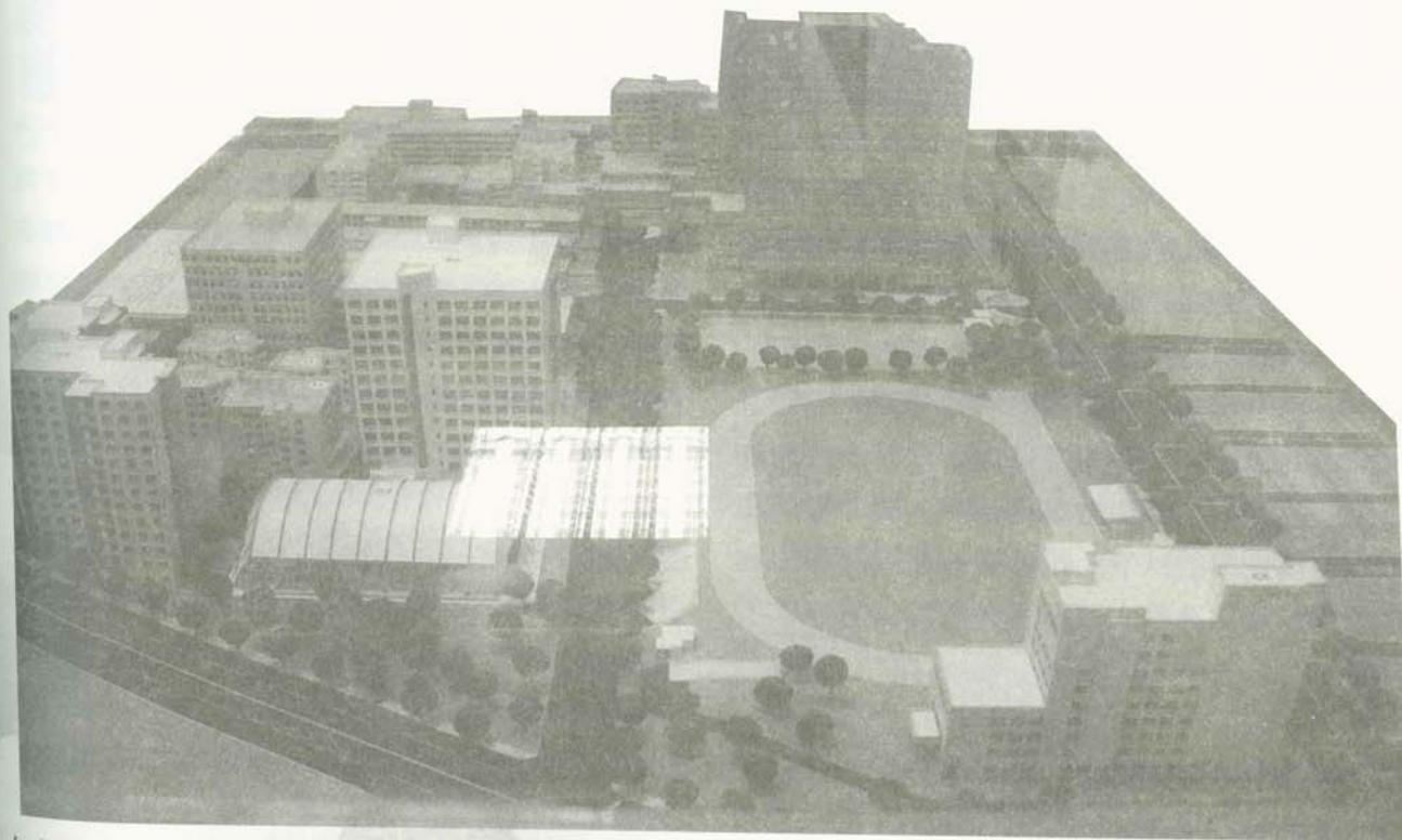
在大學城遠程發展計畫中，社區整體營造是跨越圍牆重新進行社區互動，展現大學社會責任的方式

在舊三棟的改建案停止，高醫人的共同歷史記憶沒有立即的危險後，這群學生們的注意力遂集中於改善東鄰的安生里新大港社區與高醫之間的關係，他們選擇的操作基地是兩者間共同的領域——十全一路 94 巷。這條隔開校園與社區的巷子，長期以來混亂不堪，充滿著居民與學生們的汽機車，以及居民們堆放的各式雜物；歷史空間再利用團隊推動「九四淨空行動」，即在這段期間內，社區居民與高醫同學均不得於九四巷停放汽機車，而其他像是座椅、雜物、垃圾與路霸等，也都透過溝通及由學生共同打掃的方式達成淨空。同時間並搭配發起