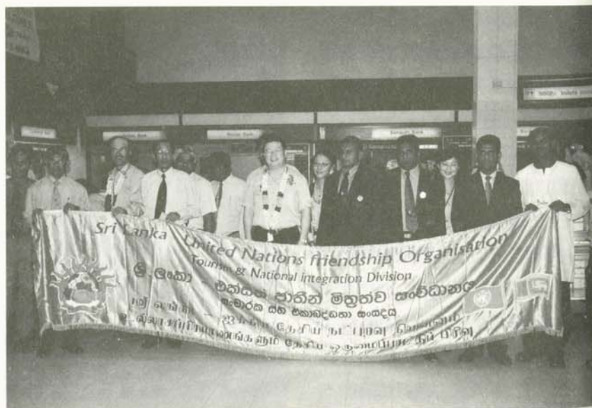
路竹會為國內原住民部落及急需醫療援助的第三世界國家提供義診與急難救助活動

診視為一趟寶貴的學習之旅。許多義診地區因環境落後而產生許多醫療及生活上的問題，其中大部分都不是路竹會能力所及之處，對路竹會而言，義診只是為當地居民盡點心力，而從另一角度看來，義診地區許多罕見的病例無疑是醫療人員提升專業知識、技術的最佳學習資源，難怪曾有參與義診的醫生說道：「書上有寫的疾，當地都有；書上所沒提到的，當地也有。對我們醫生而言，到當地義診事實上收穫比付出還多。」除了有形的專業收穫外，許多無形的精神收穫更是深深觸動義診人員的心靈，吸引他們無怨無悔的付出！首先，第三世界特有的原始、自然、純樸的美，這種