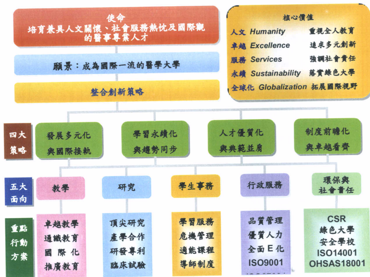
圖 3.2.2 臺北醫學大學整合創新策略圖

在品質教育委員會之運作與全校教職同仁之共同努力下，本校已相繼完成 ISO9001、ISO14001 及 OHSAS18001 之認證，同時亦申請加入綠色大學之行列。循此模式，由校長主導，在校務會議及各級委員會與小組會議中，本校針對教學、研究、學務、行政、醫療及服務六大業務範疇，依其發展方向與實務需求，各自擬訂四項整合創新策略：(一)發展多元化·與國際接軌；(二)學習永續化·與趨勢同步；(三)人才優質化·與典範並肩；(四)制度前瞻化·與卓越看齊。