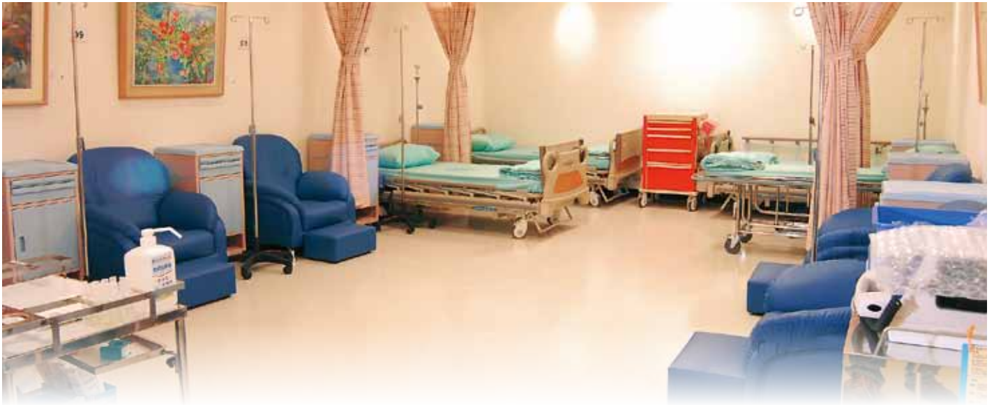
■ 進行化療的空間舒適且明亮，有效降低不安的感受