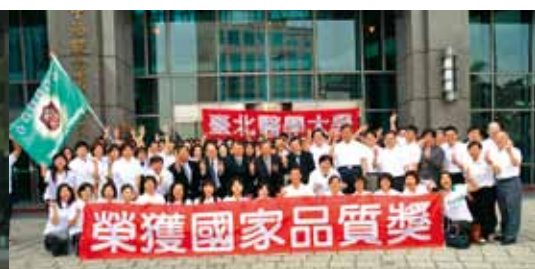
於校長任內帶領臺北醫學大學榮獲第20屆行政院國家品質獎