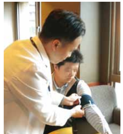
醫師指導正確血壓量測方式，透過雲端網路可輕易掌握完整血壓曲線圖

晚都要量，至少量測兩次取平均值，量血壓時座椅要有靠背，不要講話，雙腳平放地面，手心向上，血壓機的壓脈帶要與心臟同高。雲端計畫目前以血壓計錄為主，未來也可擴展至血糖、心電圖等，建立本土資料庫。