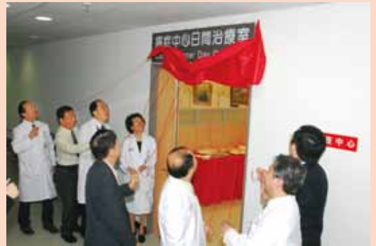
日間治療室於97年12月正式開幕，典禮當天舉行揭牌