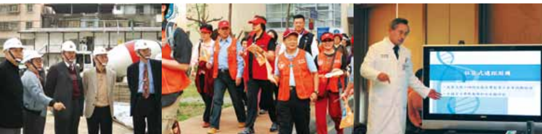
視察雙和醫院興建工程進度

在此，特別勉勵大家要有「行公義、好憐憫」之精神，存著謙卑的心，秉持「一貫且持續不斷」的精神，朝向「達成高品質高績效的國際一流大學醫院」的願景目標努力，把最高水準的醫療照護服務提供給所有的民眾。也特別祝福雙和醫院在兔年，鴻兔大展，迎向更美好未來！