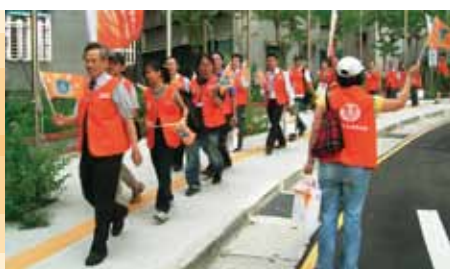
親自帶領雙和團隊深入社區，瞭解民眾需求