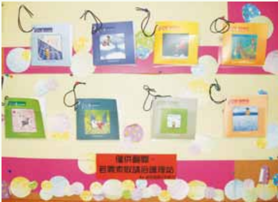
病房衛教區放置癌症醫療相關刊物，提供民眾參考