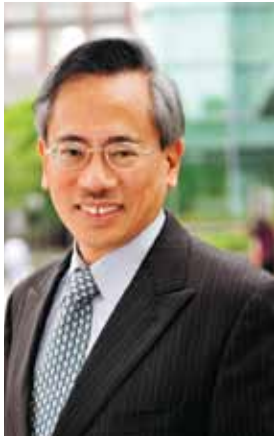
行政院衛生署署長 雙和醫院創院院長