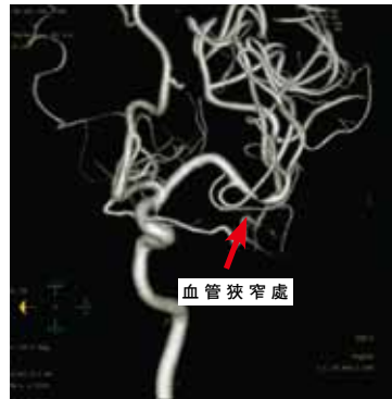
透過核磁共振造影儀，可以清楚顯示血管的狹窄處