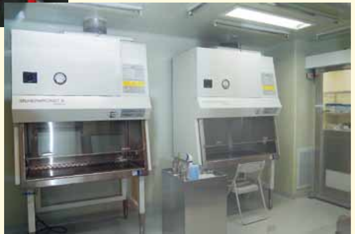
調配化學治療藥物的設備，可提供患者所需的化療藥物

一般人聽到“血液腫瘤科”這個名詞大概都感覺很陌生，不知道什麼樣的情況可以看血液腫瘤科；不然就是感覺很可怕，認為一定是癌症的病人才會來看。事實上，血液腫瘤科所負責的業務並非僅止於癌症治療而已。