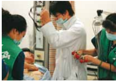
完善且即時的處置流程是搶救急診傷患的重點

「醫院緊急醫療能力」分級評定為行政院衛生署依醫院整體處理緊急傷病患之能力，包括：人員、設備、疾病處置能力與品質等，將醫院緊急