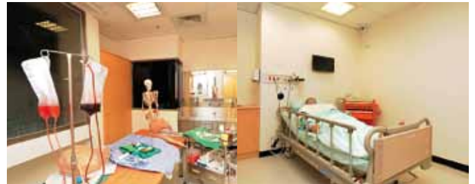
本院OSCE教學病房，各式醫療器材設備齊全

定，教案的編列及一校三院皆通用的評分表制定也非常嚴謹，通過了這次甄選後，正式成為臺灣醫學教育學會認可的國家試場。