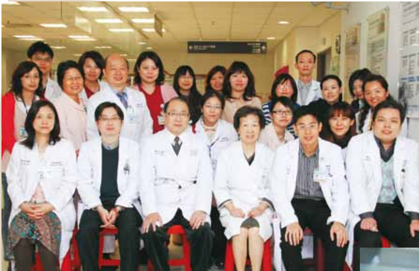
本院血液腫瘤科，由彭汪院士領軍，提供民眾最完善的癌症內科治療