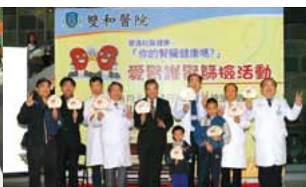
於院長任內舉辦多場篩檢活動，守護民眾健康