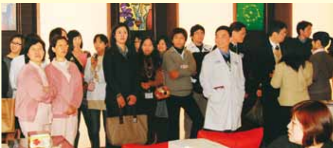
各單位同仁應邀前往記者會，見證健康美容塑身中心的開幕

本院「健康美容塑身中心」於民國 100 年 1 月 11 日正式揭牌開幕，涵蓋科別團隊有：婦產部（子宮頸癌及婦女疾病預防）、一般外科（肥胖特別門診）、職業醫學科（肥胖特別門診）、復健醫學部（肥胖特別門診）、皮膚科（醫學美容）以及整形外科（醫學美容）。