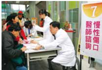
問題傷口照護中心也於現場擺設攤位，提供民眾各式相關問題諮詢