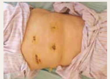
腹腔鏡直腸癌切除手術之傷口