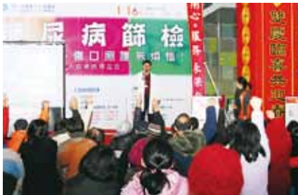
舞臺區進行的糖尿病衛教講座問答，民眾反應熱烈，紛紛踴躍搶答