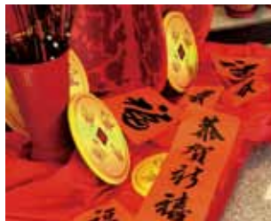
書法家們親筆揮毫，把象徵新年好運氣的春聯送給當天現場的民眾