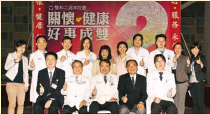
健康美容塑身中心，由各科別精英合作，提供全方位專業服務及諮詢