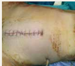
傳統直腸癌切除手術之傷口

大腸直腸癌相對於肝膽腸胃道其它的癌症而言有較好的治療效果，早期發現早期治療依然是治療和預防的不二原則，平日均衡的飲食以及適度的運動，並配合定期的篩檢檢查為最好的預防方法。