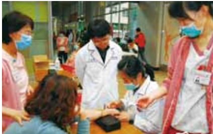
實驗診斷科負責的血液樣本採集，是活動最關鍵的部份

本院於1月16日舉辦「甜蜜寶貝，傷口照護無煩惱」活動，數百名民眾熱烈參加。檢測項目包括：空腹血糖、糖化血色素、膽固醇、高密度膽固醇、三酸甘油酯、肌酸甘、身高、體重、血壓等，藉此瞭解血糖的變化，檢查是否已是代謝症候群。