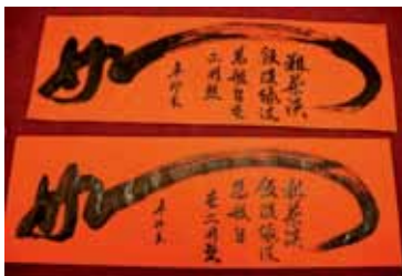
在寒冷的冬天裡，書法家們用筆墨寫出祝福溫暖大家的心