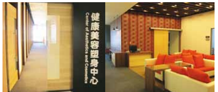
飯店式的空間設計，加分了優質的環境及貼心的舒適感