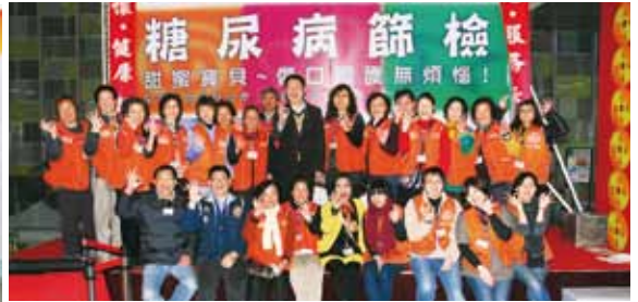
每一次活動的成功，都仰賴各部門同仁積極的配合和參與