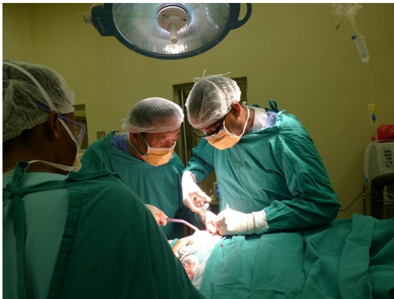
於史京醫院指導髌關節置換手術