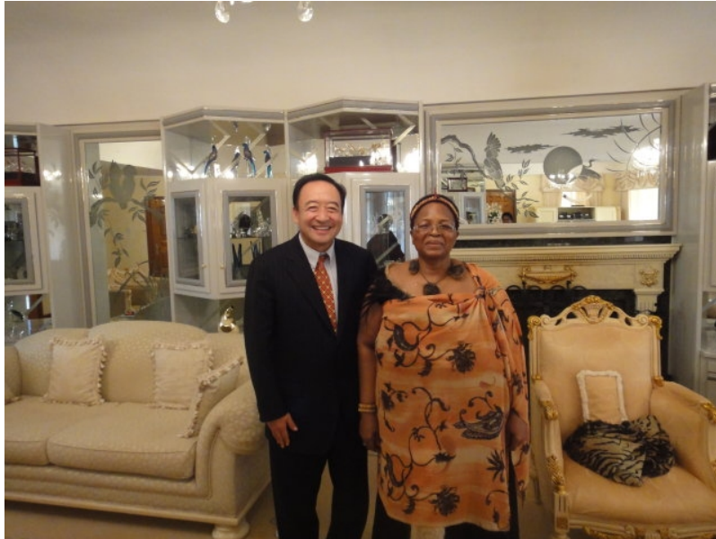
協助史瓦濟蘭王母診療並與王母合影