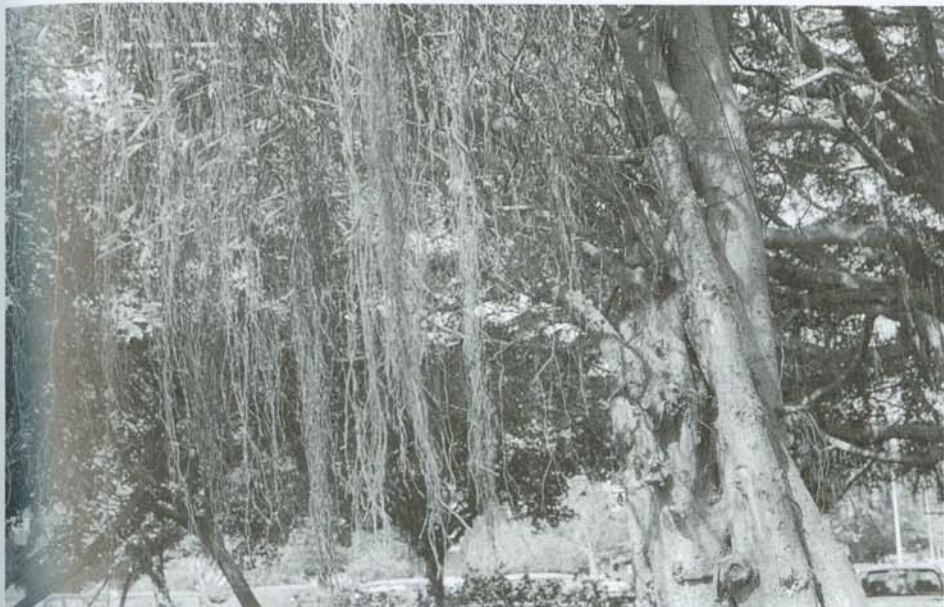
樹的鬚，迷濛成一片簾