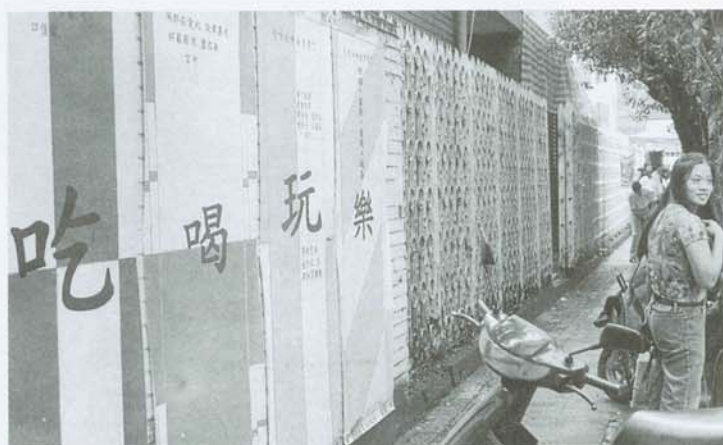
誰說人生苦短？累的時候，何妨來一客“吃喝玩樂”？