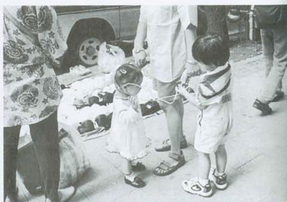
小男孩將繩子套在妹妹的耳朵上說：「來吧！我們來玩一種新的遊戲！」