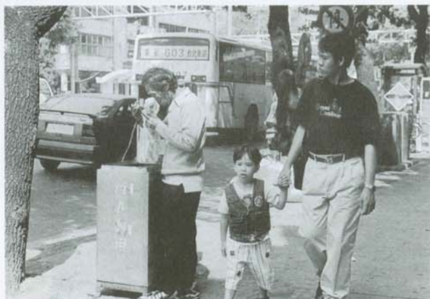
別用異樣的眼光看我，因為這是我的生活，就如同你們的一樣！