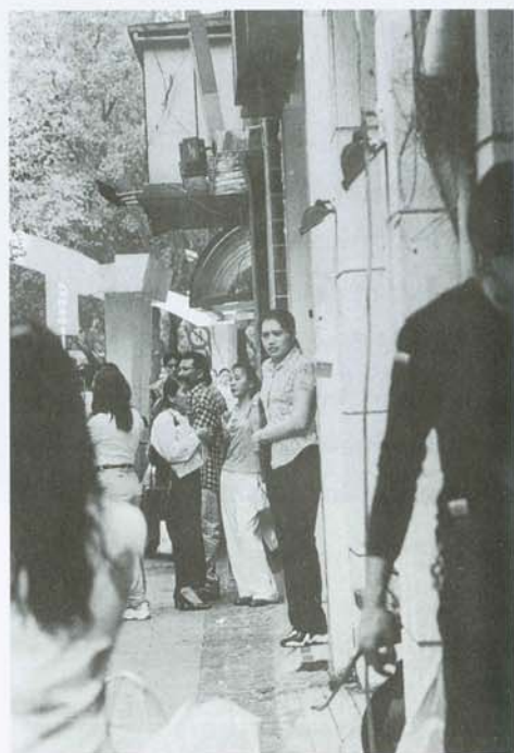
朋友？家人？愛人？匆忙的人群中，她所等待的是誰？