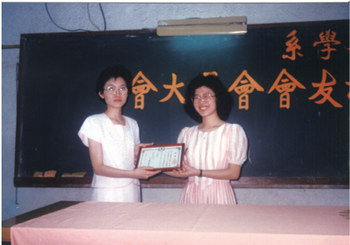
第三次校友會大會