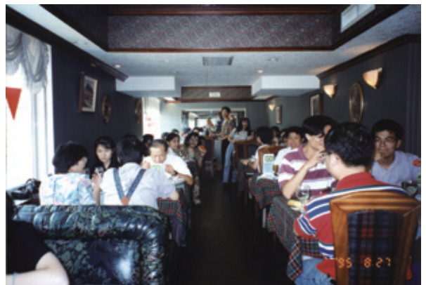
校友大會暨迎新餐會