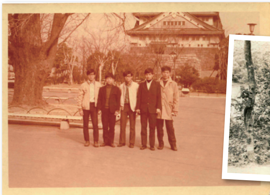
1972年3月間，北醫橄欖球隊赴日參賽團員留影