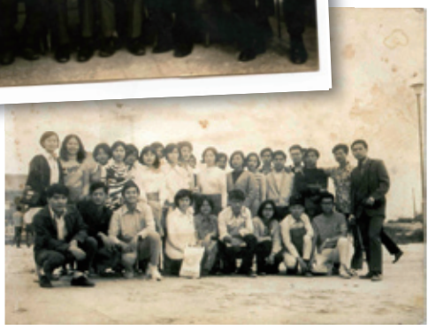
醫技科第四屆校友全班合影（1973年畢業）