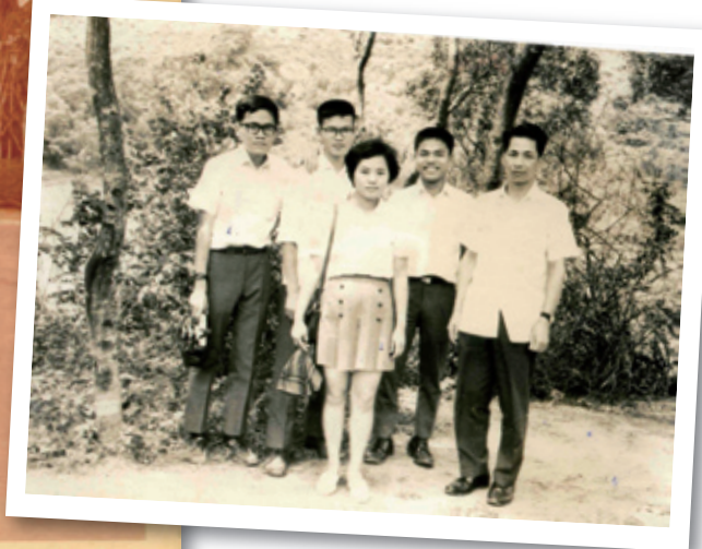
醫技科第四屆校友「師生旅遊合照」，1971年6月3日，菁草湖畔