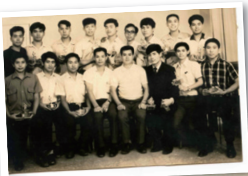
1970年6月，醫技第一屆畢業