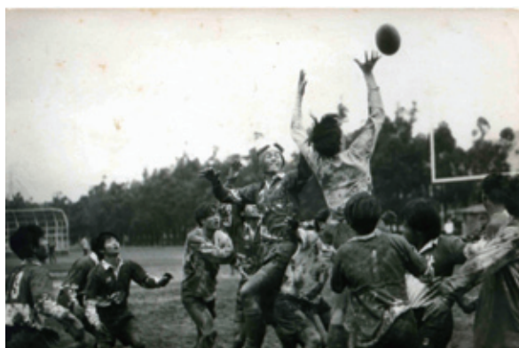
1973年11月29日，台大球場 北醫一新埔

間比賽兩場，首場以三比九敗於東京藥大（醫學杯亞軍），次場以十四比七打敗日本大學齒科部（醫學杯冠軍），此為北醫橄欖球隊的首次出國遠征，在當時物資不豐與戒嚴時期的時代背景中，能出國比賽實屬不易及光榮的事蹟，代表出賽的球員更引以為傲與珍惜。