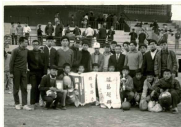
1970年元月1至4日，二十四屆大會賽於台南市立體育場北醫榮獲五專組冠軍