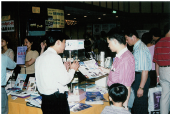
2000年6月4日牙科校友總會於台北市來來飯店舉行大會暨牙材展，吸引大批牙醫師參加

隨著牙科校友總會的成長與茁壯，每年的大會開會地點亦開始由學校禮堂或教室，移駕至五星級飯店舉行，同時舉行大規模的牙材展示、