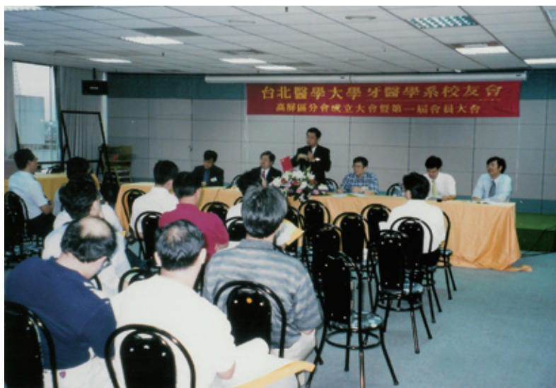
2000年6月18日北醫大學牙科校友會高屏分會於高雄市牙醫師公會會館成立

牙科校友會的「領導先鋒」，其開創性的先驅作為一直成為牙醫界意見及政策的「火車頭」，為方便說明，依發展情形，將近三十年的牙科校友總會發展史分成四個階段，分別為：開創期（一～五屆），成長期（六～九屆），成熟期（十～十三屆），守成期（十四～至今十六屆），每個階段分別有其階段性任務與使命。