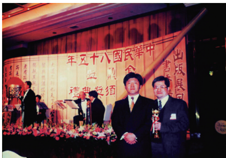
筆者（右）編著臨床牙科寶鑑，榮獲1996年全國圖書金鼎獎，1997年1月7日頒獎典禮上，與當時剛卸下北市牙醫師公會理事長，現任為衛生署副署長陳時中醫師（左）合影

為牙科校友總會創會以來第一次移駕國際會議中心舉辦，有多項破紀錄，如規模最大的一次，第一次兩天大會會期，第一次校友會舉辦之牙材展示攤位高達一百一十個，第一次同時分別在三個演講廳舉辦演講，共發出兩千多萬牙材，締造牙醫界牙材最高紀錄，七院校牙科校友會大會中的最大規模。