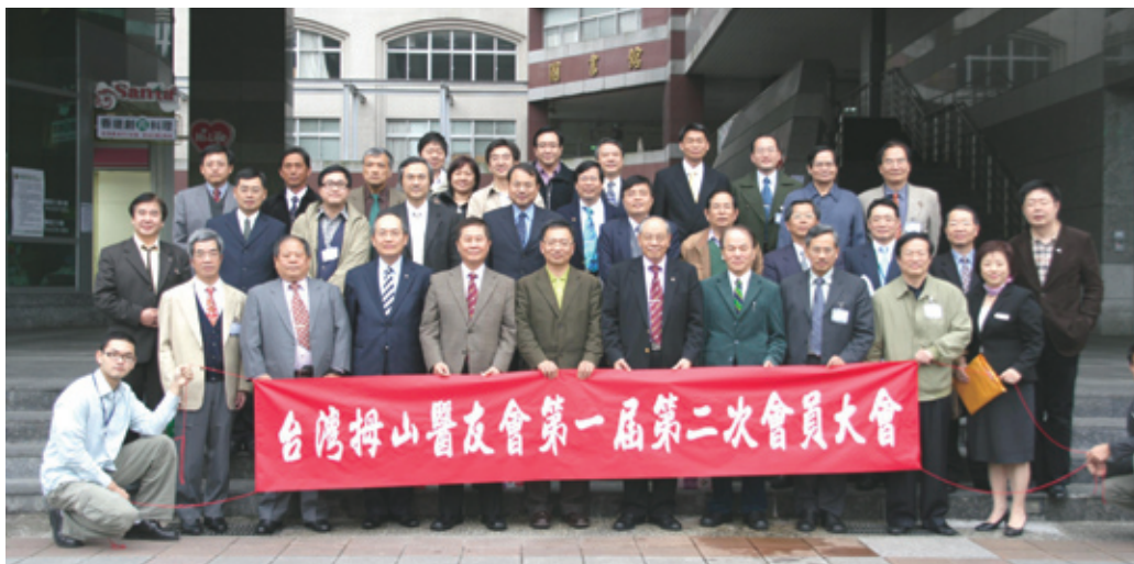
拇山醫友會第一屆第二次會員大會合影