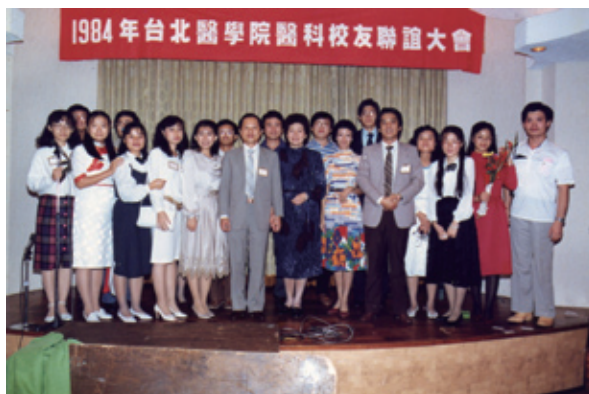
1984年范進會長任內舉辦醫學系校友聯誼大會