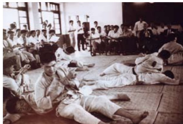
柔道社曾經是北醫風行的體育活動，多次獲獎，圖為1960年代，學生參加比賽情況

獻尤鉅；日本籍的山崎徹等先生更替劍道社帶來科學化、趣味性的劍技。由於擁有實力派的師資陣容，加上社團同學不懈的練習，因而孕育徐恆雄、游銘漢、謝文儒等傑出的國手級校友，1977年劍道社鼎盛時期更奪得大專盃、市長盃、青年盃等各項比賽的冠軍，創下光榮歷史。西洋劍社自1969年創社以來的輝煌歷史，較之先創立三年的東洋劍社一點也不遜色。該社教練李台忠先生的指導，加上學長、學姊不時從旁與以協助教導，社團同學在比賽中屢獲佳績。