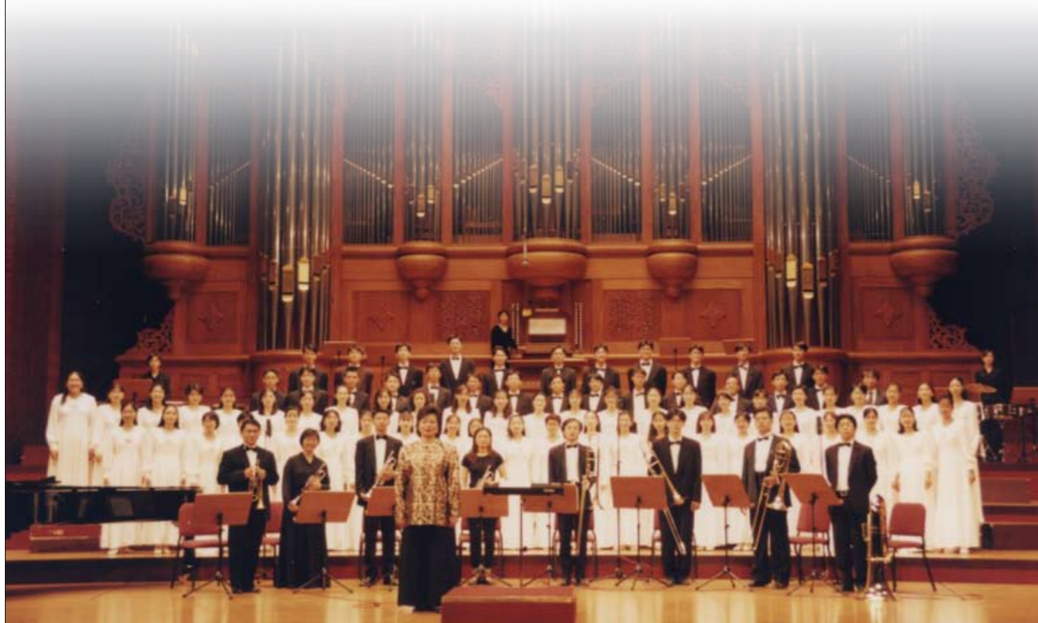
1997年杏聲合唱團於國家音樂廳演出

以上這些社團初成立的時候，沒有足夠的經費、空間或設備，但是這些社團的成立都有著一樣的精神——對人文藝術的熱愛，社團的發展中，看到了北醫學子在此中注入的生命與熱情，因為這股熱情，讓北醫校園豐富起來，讓北醫校園充滿了生命的力量，因而造就了許多輝煌耀眼的成績。此外，這些社團也陪著北醫成長、茁壯，過程中或許有起有落，看盡北醫的繁華及紛擾，也陪著北醫人度過無數的校園生活，撫慰了北醫學子的心。