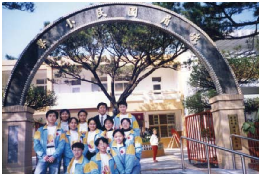
山地醫療服務隊於新竹縣峨眉國小宣導衛生觀念

「Sa' icelen ko picudad (要認真唸書)，這是我離開花蓮母親對我說的一句話。遙望母親微胖的身影，手持前往台北的火車票，內心除了離鄉情愁之外，並摻雜一種對未來的憧憬，對於一個懵懂且從未有過大都市生活的我，一切盡是如此的新鮮有趣。面對著未來學習的環境，更懷抱著許多的期許。初進北醫，可能是班上只有我一個原住民學生，再加上當時杏原社活動並不多，所以，對於自己身份的特殊並沒有特別的感受。