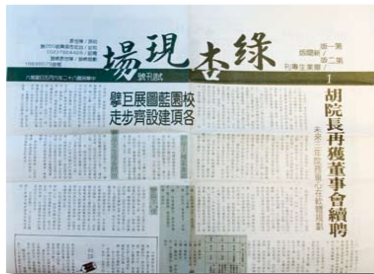
「綠杏現場」是綠杏社於「綠杏」年刊外，另闢的報紙型刊物