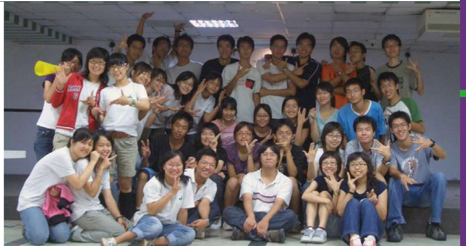
1990年代山服同學出團合影

山部落，醫療隊進入了平靜部落，而第三次採用巡迴義診的方式在廬山和平靜兩村義診，進入第四年後，原有的六社正式合併為山服團，到了山服正式成立社團後，也就是第四次出隊，除了廬山、平靜外，還去了更深山且醫療資源更缺乏的靜觀部落，奠定了山服醫療隊的雛形。