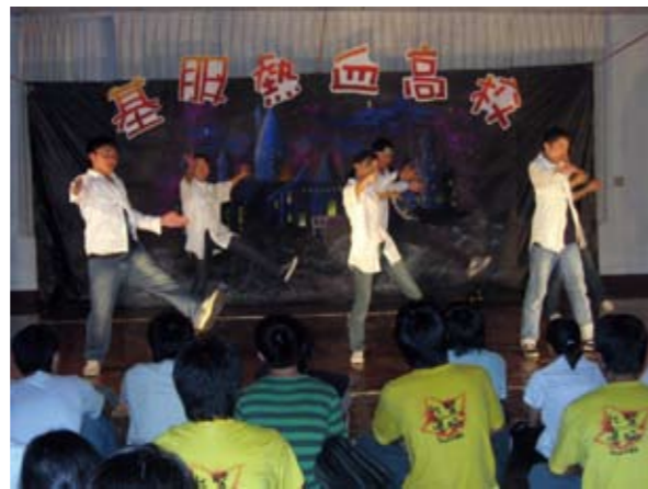
基服前身為「村里文化服務隊」，精彩晚會表演是其特色

現在基服固定舉辦的活動，除了寒暑假定點服務隊各三隊，暑假藝文服務隊一隊以外，學期中對內為幹訓、隊訓及送舊活動，對外為每學