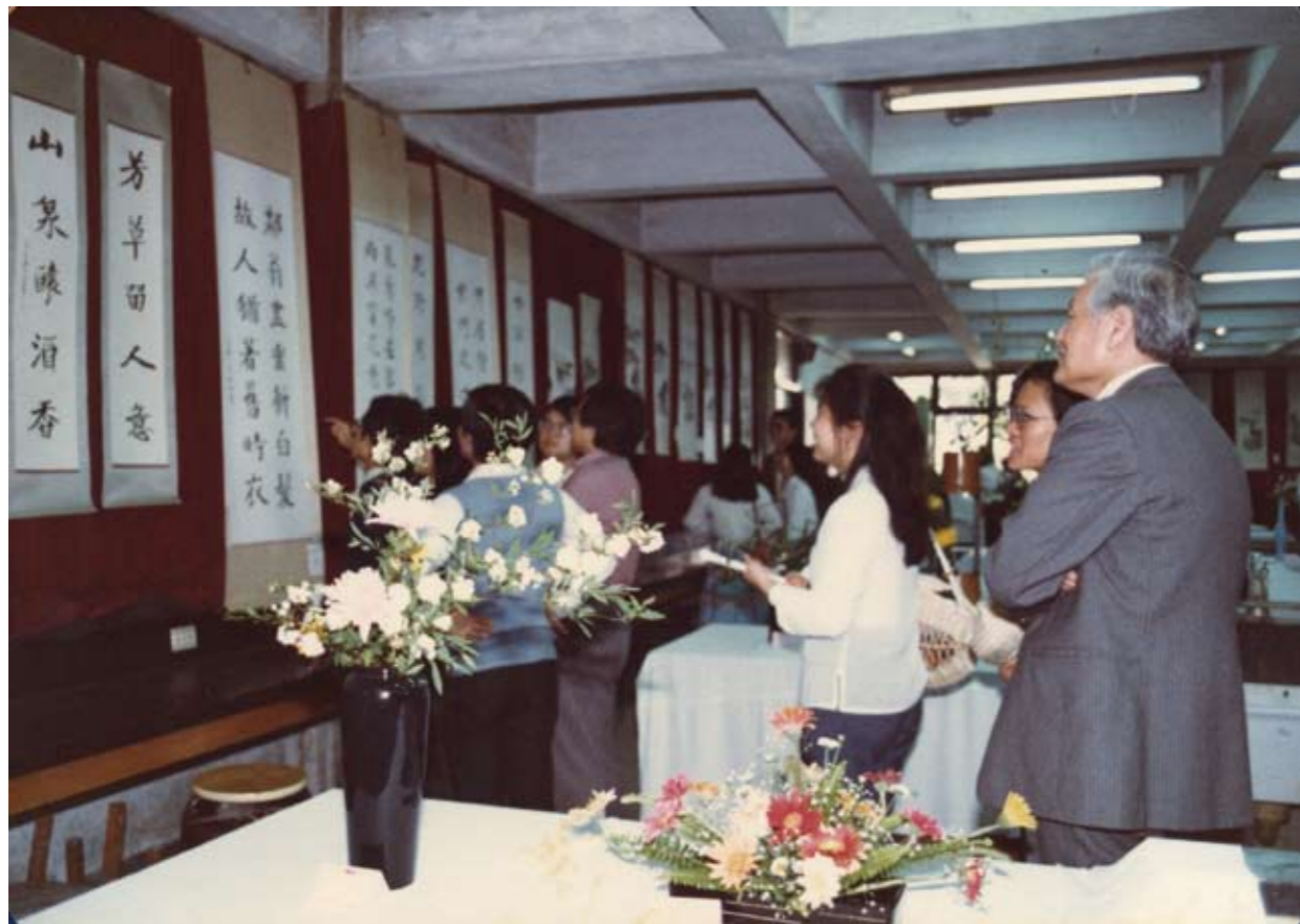
1980年代書法社與花道社聯展

是全校唯一的鋼琴。合唱團發展的初期，規模並不是很大，之所以成立是憑藉著一群北醫師生對音樂的熱情與愛好，起初的活動大部分以校內為主，或在院慶晚會及迎新、送舊等場合獻唱，或而一群人聚在一起時，隨性便哼唱了起來，直到1962年6月，杏聲合唱團才舉行了第一場公開演唱會，也開啟了杏聲在北醫的另一個階段，在院長和董事長的支持下，杏聲如期演出了這一場音樂的盛宴，當時全場轟動的掌聲，肯定了杏聲合唱團團員們的努力和付出，此後杏聲開始活躍於校外各項活動，完成了院歌的演唱，並積極參加國內各項音樂比賽，以樂會友，開拓了音樂的視野。此外，1983年，本著「以音樂美化人生，以藝術服務社會」之宗旨，首次舉辦全省的巡迴演出，透過比賽及巡迴演出，社團的凝聚力更強，透過壓力與磨練，團員努力期許提昇自己的