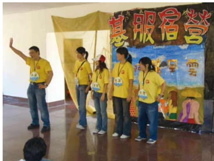
基服團員大多活潑愛表現，具有帶動氣氛的能力

北醫山地社會醫療服務團原名山地社會醫療服務隊，成立於1990年。當初第一次出隊選在暑假原住民農忙的時候，幫忙分攤教會的工作，以兒童育樂營的方式陪著小朋友。一方面發揮醫學院校的特色，用家訪、衛教和義診的方式，提供正確的醫療保健常識。第二次的出隊，到了南投縣廬