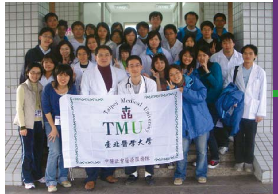
中醫社會醫療服務隊

二十五年前，北醫羅浮群率先出現，由童軍運動的承襲和推廣，帶起這波服務的熱潮。接著，康輔為花蓮小朋友舉辦的育樂營及輔導社區青少年的活動加入行列。樂幼社開啟北醫人對動物以及對老年人的關懷之路，更定期提供了我們