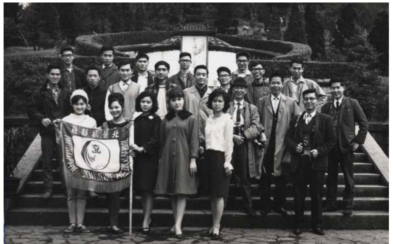
1960年代攝影社前往陽明山攝影活動

北醫人報一路走來，秉持的社訓：「明是非之辨，執春秋之筆」，是北醫人報從艱辛創社的成員到今天共同努力的全體社員們，都謹記著不變的精神。北醫的成長是有目共睹，人報因為關心校園時事，從學生的角度出發，所以將熱愛的那一種心情轉為文字，報導出來，甚而做成專題更深入去探討，無非是要培養每一個在校的學生能夠主動參與、關心周遭的事務，養成一個大學生獨立思考的人格特質。現在是個高倍速的時代，什麼都講求「另類」，而人報的「另類」風格也是遵循著「我思，故我在」的精神目標在前進，期盼以一個新聞記者公正、公平、客觀的角度去關心時事、國事、天下事。