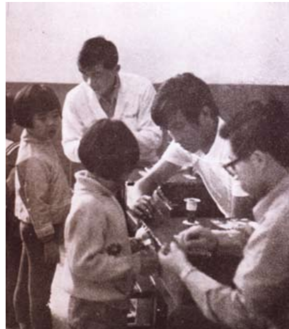
學生到偏遠地區為兒童義診

杏聲由家庭式聚會發展到巡迴演出，近年來更在參與教育和公益事業中不斷提高專業。北醫校刊「綠杏」以專題討論各種醫學生所關心的議