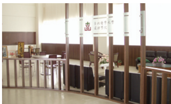
醫學綜合大樓護理學院大廳

為提升本系所教師之學術研究能力，本系所於1997年開始每月定期舉辦一次研究討論會（Research Meeting），鼓勵教師分享研究經驗交換研究成果，至今未曾間斷。並於每年主辦大型研討會，邀請國內外學者共同參與。1998年護研所開始增加甄試入學方式。