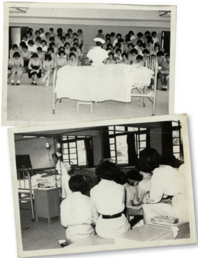
1960年代護理助產專修科示範教室內景，及授課狀況

兒科護理學、婦產科護理學、精神科護理學、護理行政、公共衛生護理學等。1989年將護理I (Nursing I) 及護理II (Nursing II) 又改回各科護理課程，沿用至今。