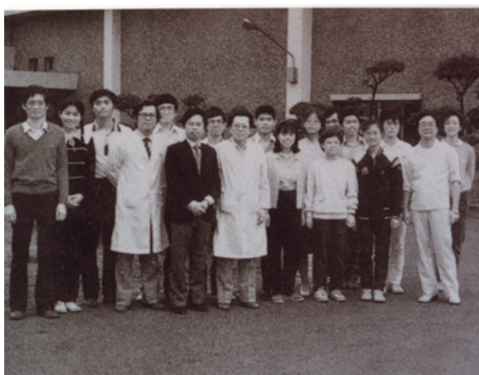
1984年藥學系參觀藥廠

在2000年臺北醫學院改名為臺北醫學大學時，藥學系與藥學研究所合併成為系所合一之學系，再加上原有的生藥學研究所，及新設的生物資源技術學系，組成目前的藥學院。藥學院創院迄今已有六年，現任院長為闕壯卿講座教授。本學院目前招收藥學系四年制大學部學生每年約兩百人，碩士班及博士班學生每年招收各約四十五及十人。本學院大學教育的使命為提供基礎與臨床藥學並重的專業藥學課程、實驗與實習，培育藥學系學生畢業後成為有能力之專業藥師，參與製藥、調劑、販賣及管理、照護病患之用藥安全、療效品管，以提升國民生活健康品質；本學院研究所教育的使命有二：（1）培育研發新藥之基礎藥學專門人材，（2）培育以病人照護為中心的專業臨床藥師。