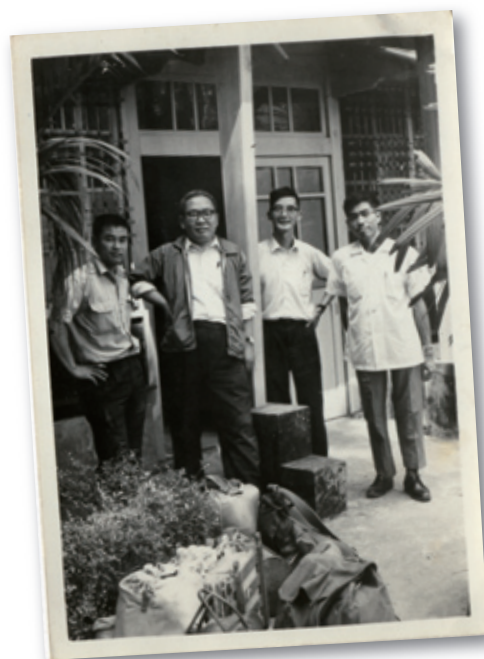
生藥學科採藥一行人（攝於嘉義）

2000年藥學院成立之初，由藥學系系主任許光陽教授暫兼院長一職，首次向教育部提出藥學教育改革計劃。2001年由美國加州大學聘請林宗仁教授擔任第一任院長，林院長為藥學系第二屆校友，在其任內整合藥學院系所課程，同時延攬臨床藥學方面師資，對藥學教育改革推動不遺餘力。2003年陳繼明教授代理院長職務，繼續林前院長之教學理念，同時帶領本學院在穩定中成長。2004年由美國國家衛生研究院聘請第三屆校友闕壯卿，擔任講座教授兼第二任院長，現階段闕院長正積極規劃藥學院空間，並致力於推動藥學教育改革計劃，邁向國際接軌之專業藥學教育發展，繼續增聘臨床藥學專業師資。經由藥學教育改革，期能培育藥學系學生不只具有製藥、製