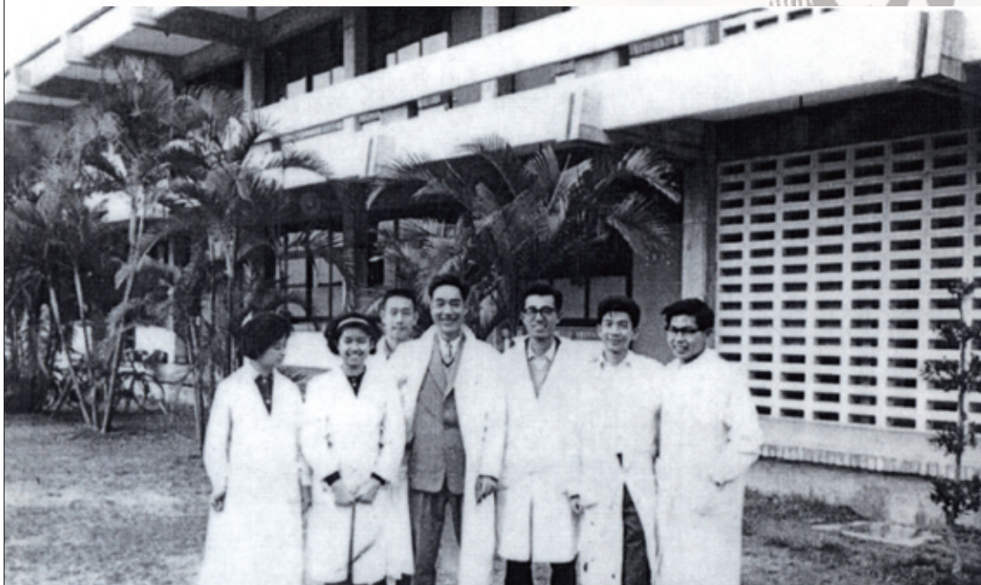
藥學系第一、二屆，圖中為顏焜熒教授