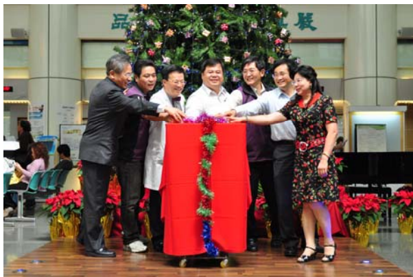
聖誕點燈 場面熱鬧