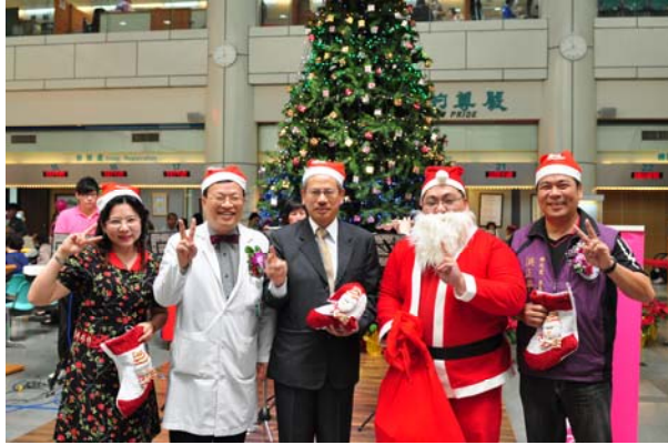
耶誕送糖溫馨處處