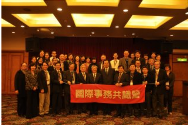
國際事務共識營 凝聚全校國際化共識