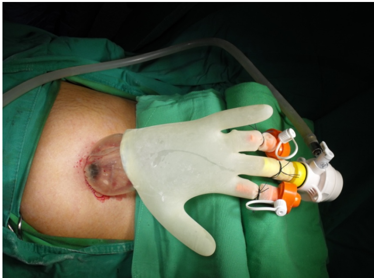
手套+保護套充氣後產生手術的操作空間