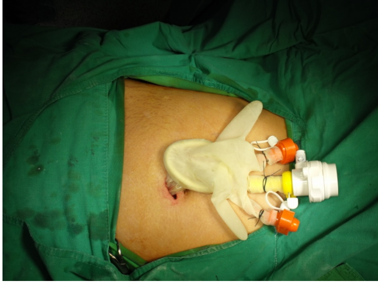
將手套手指處剪開，讓視訊及手術器械穿過手套及保護套進入腹腔