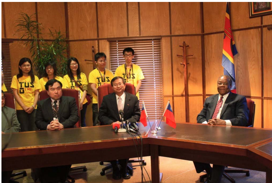
由蔡明耀大使偕李副校長及北醫志工團訪問總理 Bernabas S. Dlamini