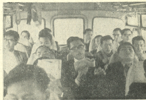
。頓勞的途旅却忘以藉，曲一歌高家大，中車覽遊在