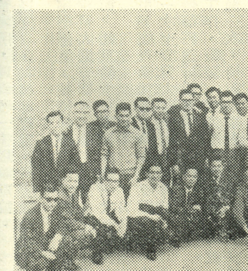
。照寫島華光潭月日遊——歸須不雨細風斜

短短幾天的共同生活，使彼此都更加了解，更趨團結。在這次可貴的經歷中，我們得到了友情的珍貴。今後無論走到那裏，我們都將不會忘記：我們是北醫第二屆醫科的一員！