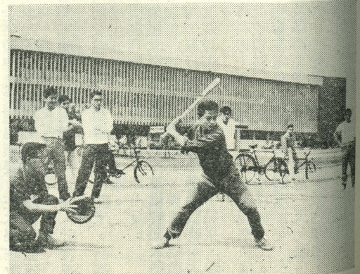
下圖：自然杯壘球賽經半月鏖戰，醫五、醫二、藥化、生化、藥二、藥隊領先。圖為醫五、藥三對壘一鏡頭。

上圖：三月廿八日北醫攝影社在圓山舉辦人像攝影會，攝影名家陳學文、劉長壽皆親臨指導。