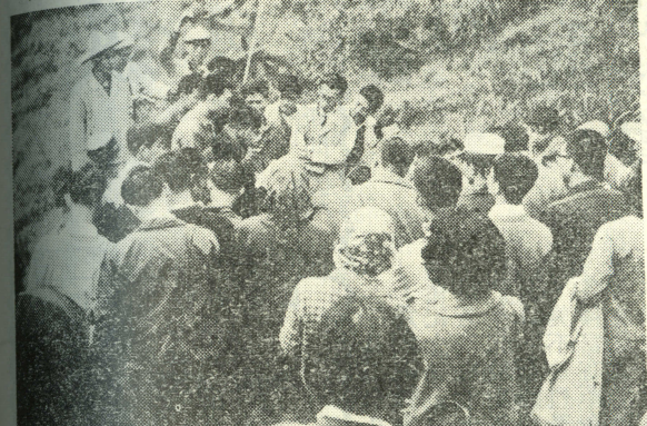
聽們生學給解講地盡詳家專由，本標草藥種各的集採所

唱臺灣民謠，其樂融融，最後以一曲「當我們同在一起」，將大家的情感緊緊連繫起來。大家就這樣子，大家載笑載語，踏向歸途。這一郊遊，可以說是能够把握住在遊樂中不忘學問的深長意義。(自熱會)