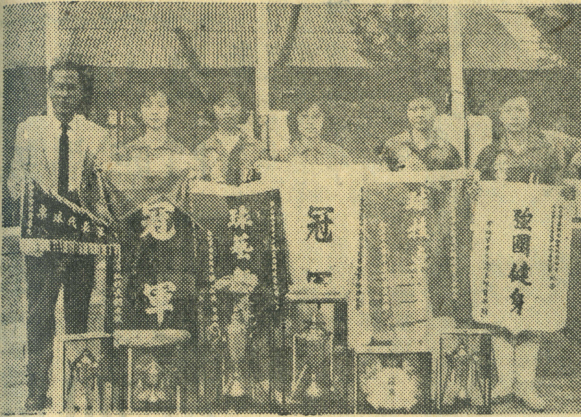
軍季組女社及軍冠打單人個、體團組子女專大