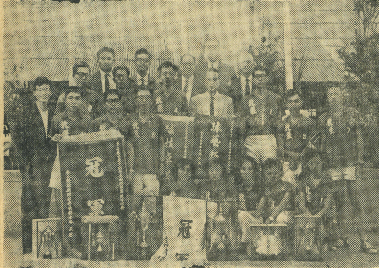
隊表代女男院學本的勝全得獲賽球桌「杯中」加參