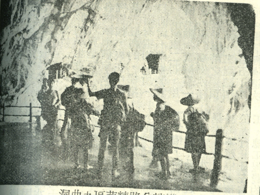
橫貫公路精華區九曲洞