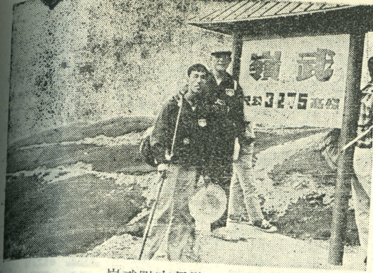
橫貫公路高崙點嶺